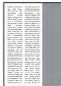
1/3 верт.; 75x275