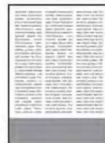
1/4 гор.; 215x65