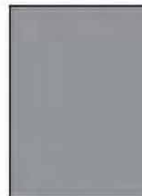
1 полоса.; 215x275