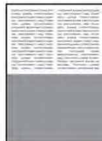
1/2 гор.; 215x135