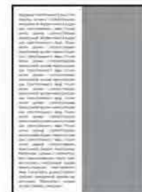
1/2 верт.; 105x275